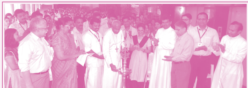
ക്യാപ്പ് ആറ് ക്യാമ്പസ് - കാൻസർ ബോധവൽക്കരണ സന്ദേശയാത്രയ്ക്ക് ജൂബിലി മിഷൻ മെഡിക്കൽ കോളേജിൽ സ്വീകരണം നൽകി